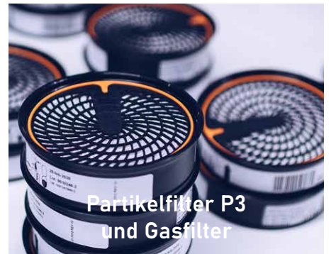
Partikelfilter P3 und Gasfilter