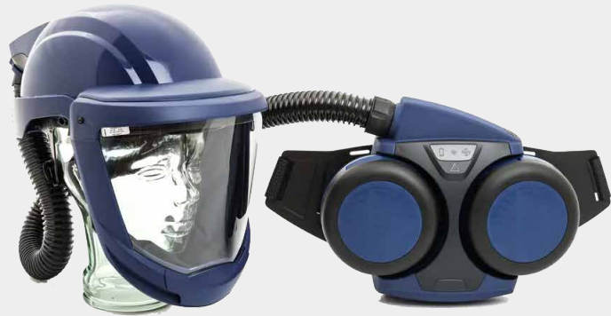
SR 580 Schutzhelm mit SR 500 Gebläse

Förderung der Sundström Geräte durch die BG Bau auf Gebläseunterstützte Filtergeräte mit Helm (z. B. SR 500 Gebläse mit SR 580 Schutzhelm)