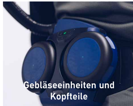
Gebläseeinheiten und Kopfteile