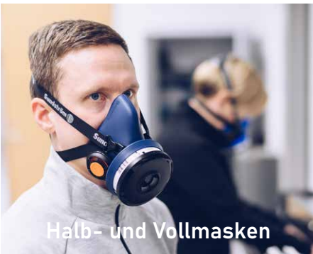
Halb- und Vollmasken